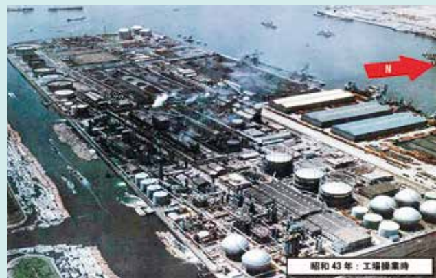
30数年間、365日有害物質をたれ流していた東京ガス豊洲工場跡地

「豊洲市場が開場すれば、毎年100億円～150億円の赤字が生まれ、60年後の累積赤字は1兆円」「築地市場は最終的に黒字になる」（都の市場問題プロジェクトチーム報告書）