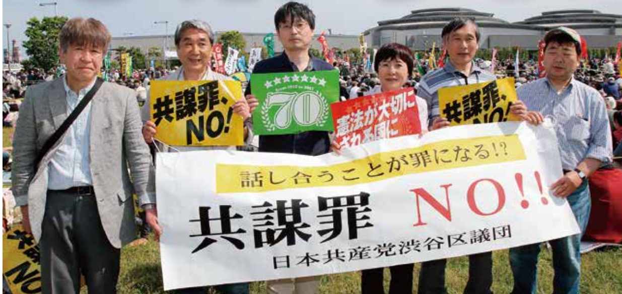
5月3日の憲法集会に区議団として参加

内心の自由を踏みにじるテロ準備罪は、憲法違反であり、政府に撤回を求めるよう区長に迫りました。